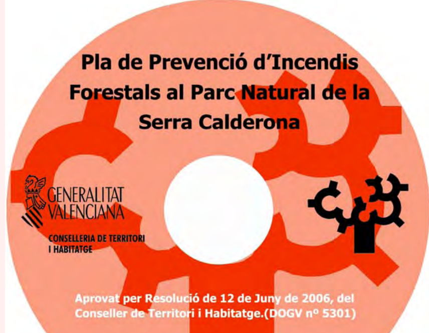
Pla de Prevenció d'Incendis Forestals al Parc Natural de las Hoces del Cabriel

Además y en el campo de la planificación se finalizarán los 4 primeros Planes de Prevención de Incendios Forestales de Demarcación (Altea, Segorbe, Polinyà del Xúquer y Chelva), se aprobarán los Planes de Prevención de Incendios Forestales de los Parques del Túria, Penyagolasa y Tinença de Benifassà. Y comenzará la redacción de 3 nuevos Planes de Demarcación (Alcoi, Xàtiva y Sant Mateu) y los Planes de Prevención de Parques de Chera-Sot de Chera y Puebla de San Miguel.